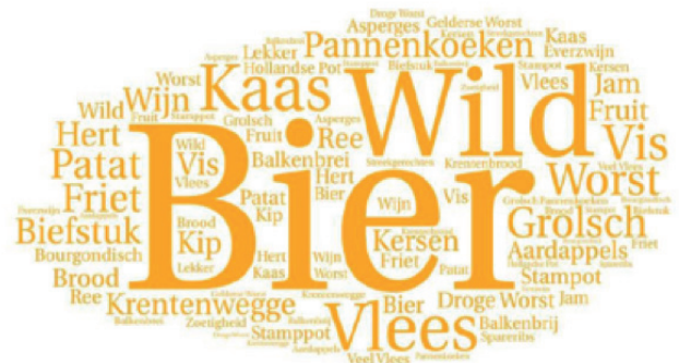
Associaties met eten/drinken in de Achterhoek

Circa 45% van de Nederlanders weet een associatie te noemen bij eten/drinken in de Achterhoek. De meest genoemde associaties zijn Bier, Wild, Vlees, Kaas en Pannenkoeken. Gemiddeld vindt 39% van de Nederlanders dat lekker eten en drinken een sterk punt is van deze regio. Opvallend hierin is het verschil tussen bezoekers (52%) en niet-bezoekers (24%) van de Achterhoek.